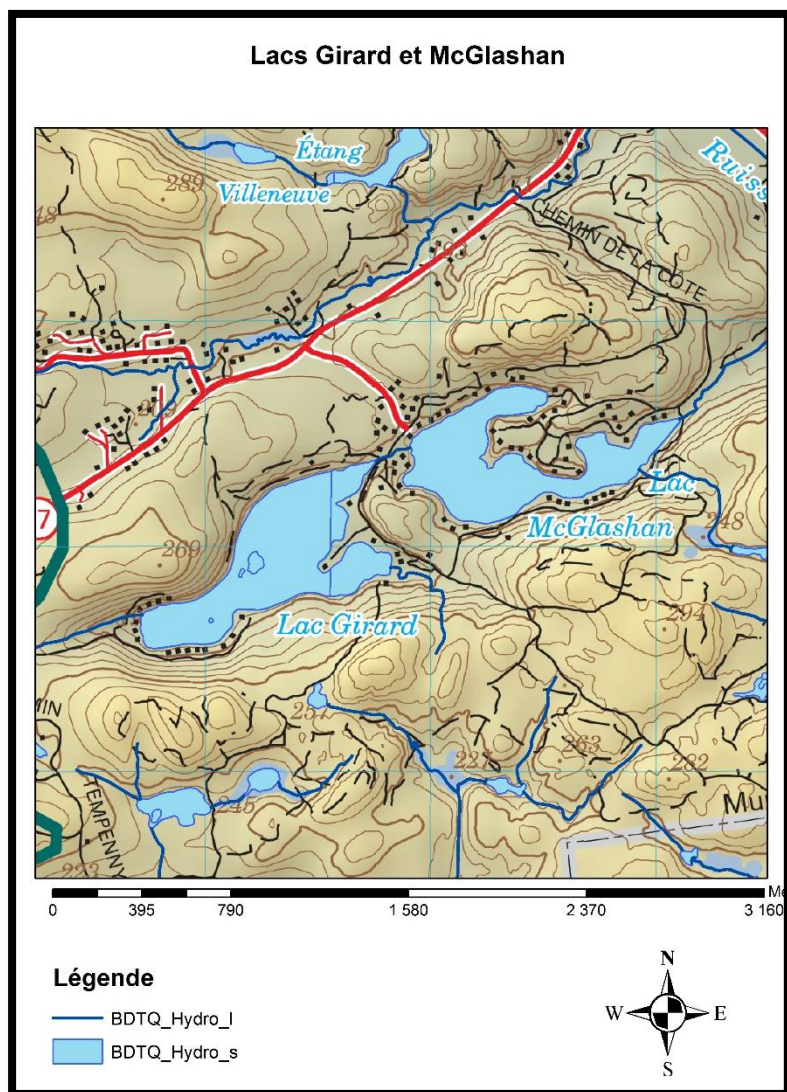
Figure 1. Carte du bassin versant du lac Girard à Val-des-Monts.

Les échantillons d'eau ont été prélevés dans une seule station d'échantillonnage au centre du lac à trois (3) reprises au cours de l'été, soit le 15 juin, le 13 juillet et le 23 août 2015. Les paramètres inventoriés sont le phosphore total, la chlorophylle a et le carbone organique dissous. La transparence de l'eau n'a pas été relevée. Tout le travail d'échantillonnage a été possible grâce au travail des bénévoles du lac Girard.